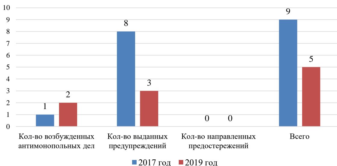
Рис. 1. Количество нарушений антимонопольного законодательства в 2017 и в 2019 году, ед.

На основании сведений, полученных в ходе запроса в Управление Федеральной антимонопольной службы по Иркутской области о предоставлении информации о количестве нарушений антимонопольного законодательства ИОГВ, установлено, что в 2019 году ИОГВ и Правительством Иркутской области было совершено 5 нарушений антимонопольного законодательства, что в 1,8 раза меньше, чем в 2017 году (рис. 1).