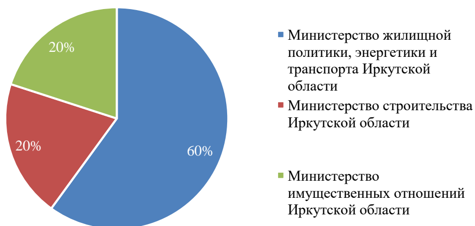
Рис. 3. Удельный вес нарушения антимонопольного законодательства, совершенных каждым ИОГВ в 2019 году

По результатам анализа нарушений антимонопольного законодательства ИОГВ в 2019 году составлен перечень нарушений с указанием нормы Федерального закона от 26 июля 2006 года № 135-ФЗ «О защите конкуренции» (далее – Федеральный закон № 135-ФЗ) и иных нормативных правовых актов, которые были нарушены, и краткой информации о нарушении (см. табл. 1).